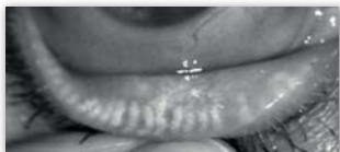
stark geschädigte Drüsen