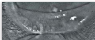
Drüsen fast vollständig abgestorben